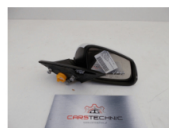
BMW F32 LUSTERKO