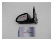
BMW G01 LUSTERKO