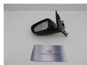
BMW G30 LUSTERKA